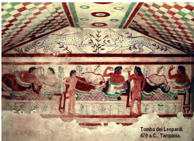
Tomba dei Leopardi. 470 a.C., Tarquinia.

Le pitture etrusche che sono giunte fino a noi, sono gli affreschi che decorano le pareti delle tombe. I soggetti sono le feste e gli spettacoli, i giochi, le danze e i banchetti in onore del defunto.