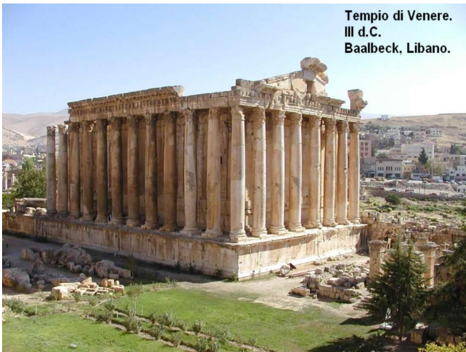
Tempio di Venere. III d.C. Baalbeck, Libano.

L'ordine corinzio si sviluppò in Grecia alla fine del V sec .a.C.